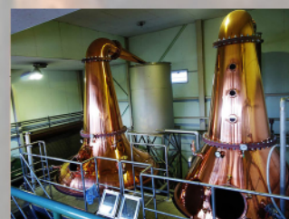
マルス信州蒸溜所・ポットスタイル